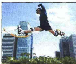
I salti acrobatici sulle potenti molle dei powerbock

POWERBOCKING Di sicuro appeal per giovani e giovanissimi, utilizza degli speciali trampoli, i powerbock, progettati dal tedesco Alexander Bock, e già usati in diverse palestre per effettuare esercizi e ottenere risultati simili a quelli raggiungibili con lo step. I powerbock sono dotati di potenti molle che sfruttano il peso del corpo per far compiere balzi elevati, anche fino a tre metri, e passi poderosi. Info: www.powerjump.it