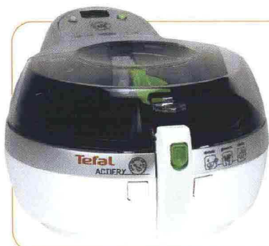
Friggitrice Tefal ActiFry 7000 Prezzo € 199 Web tefal.it

Natale si avvicina e le idee regalo scarseggiano? Ecco i cinque suggerimenti che altrettanti vip hanno affidato al guru della comunicazione Igor Righetti