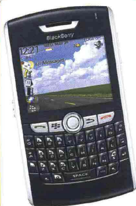
BlackBerry 880 Prezzo € 429 Web it.blackberry.com