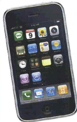
Smartphone multimediale iPhone 3G Prezzo da € 499 Web apple.com/it