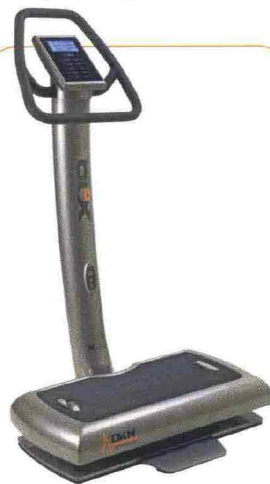
Pedana vibrante DKN XG 10 Prezzo € 2.490 Web dknitalia.it